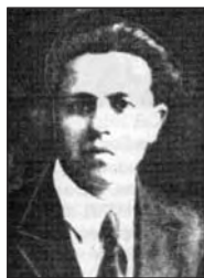
ХАТУЛЁЎ Пятро (Пётр Фёдаравіч), 1912, Віцебск, літаратурны крытык.