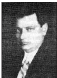
ЧАРНУШЭВІЧ Аляксандр Анікевіч, 1899, Капыль, партыйны і дзяржаўны дзеяч, наркам асветы.