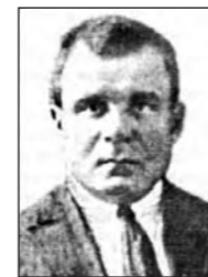
ДЗЯКАЎ Ананій Іванавіч, 1896, Багданаўка Мсціслаўскага, рэктар БДУ, наркам асветы.

ДЗЕНІСКЕВІЧ Мікалай Міхайлавіч, 1904, Закаблукі Мінскага, другі сакратар ЦК КП(б)Б.