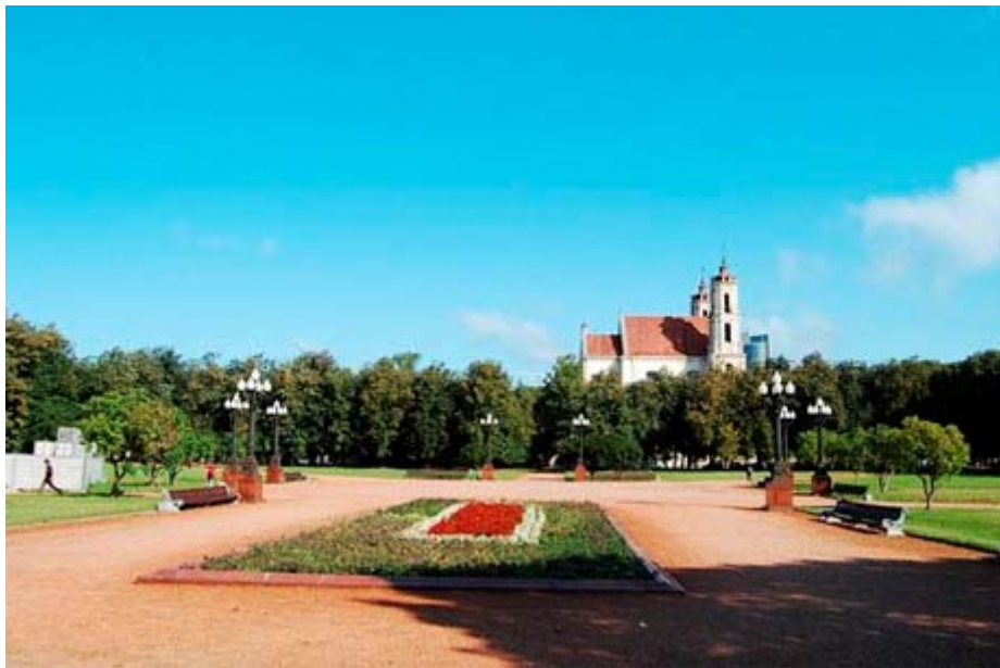
На меркаваным месцы пакарання, амаль пад самым касцёлам Святых Якуба і Піліпа стаіць памятны крыж і паваянная мемарыяльная пліта ў гонар герояў - Каліноўскага і яго паплечніка Зігмунта Серакоўскага , кіраўніка паўстання ў Жамойці, павешанага тут яшчэ 27 чэрвеня 1863 г.