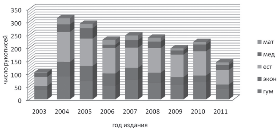
Диаграмма 2. Численность рукописей с грифом МО РБ по научным направлениям за период 2003 – 2011 гг.

Разделение всех единиц анализа на следующие (условные) группы: гуманитарные науки и искусство, науки экономического профиля, естественнонаучные, медицинские (а также спорт) и математические науки создает еще более любопытную картину. В рамках естественнонаучного направления львиная доля учебных материалов приходится на публично санкционируемые педагогической властью химию, физику и агрономию. В раскладе гуманитарных дисциплин преобладают филология и право. Предметно-дисциплинарная наполненность анализируемых единиц представлена в Диаграмме 2.